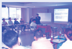
北田会長より説明「白山市PTA連合会とは」